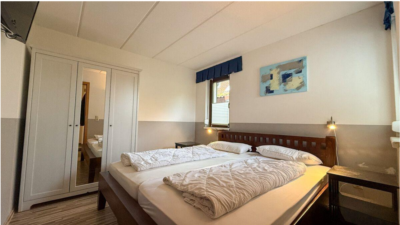
Schlafzimmer 1. EG