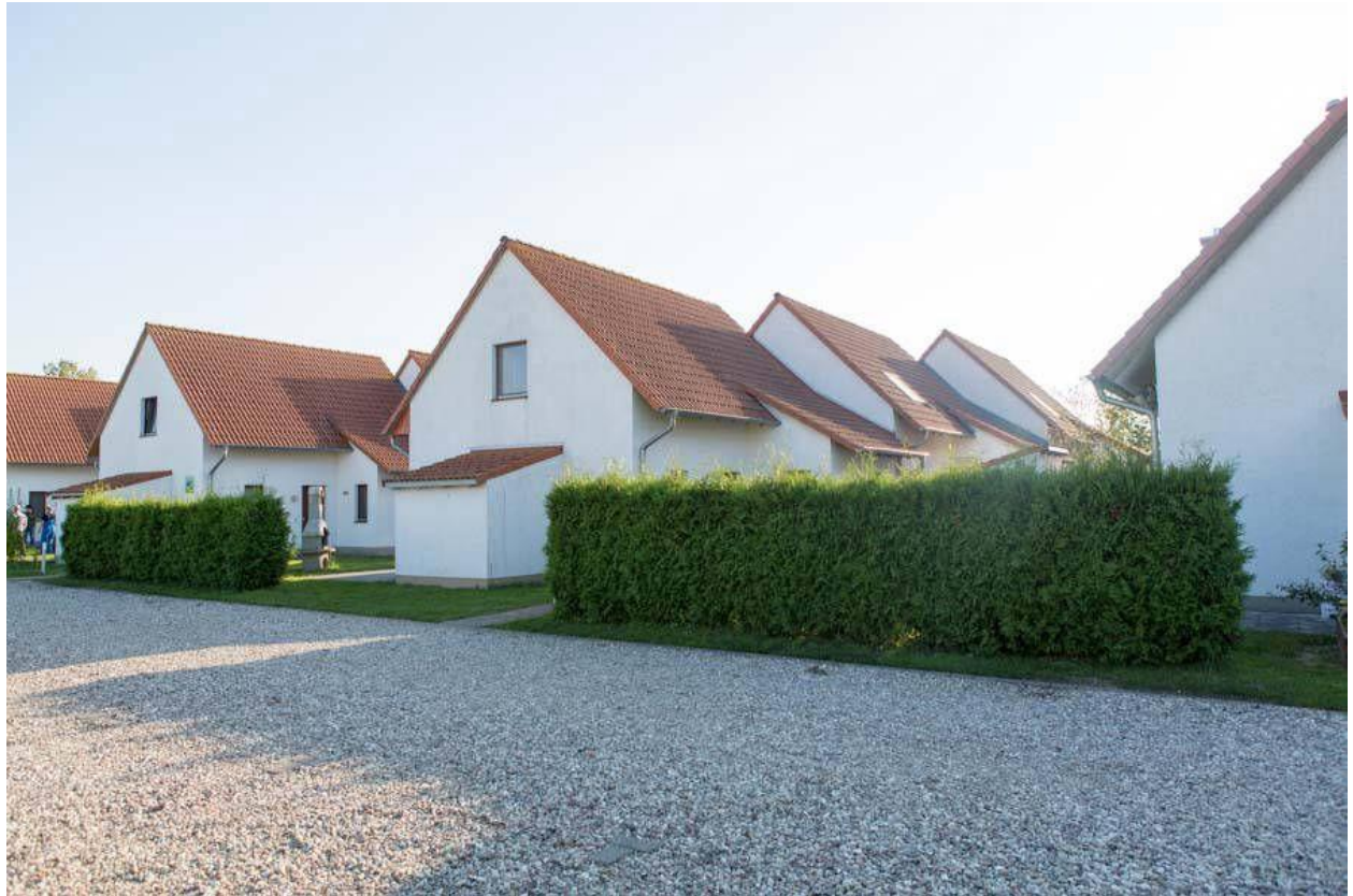
Blick vom Parkplatz