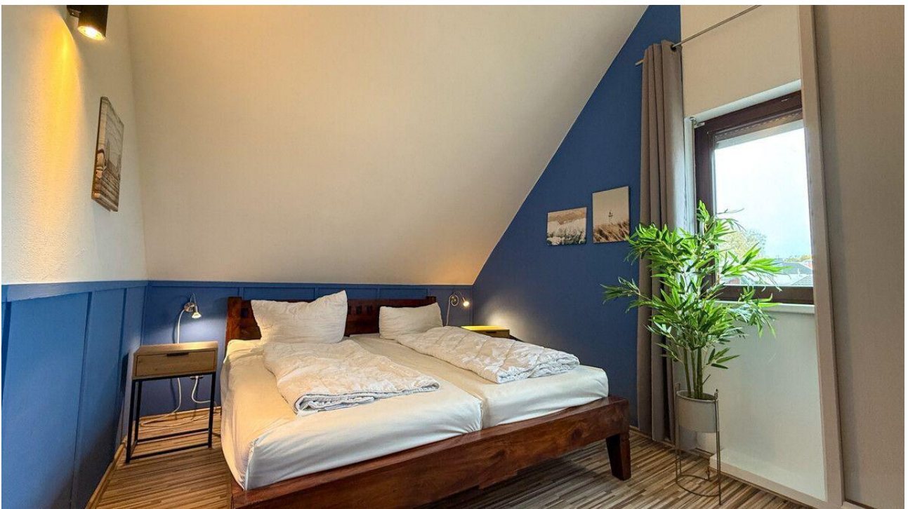
Schlafzimmer 3. OG