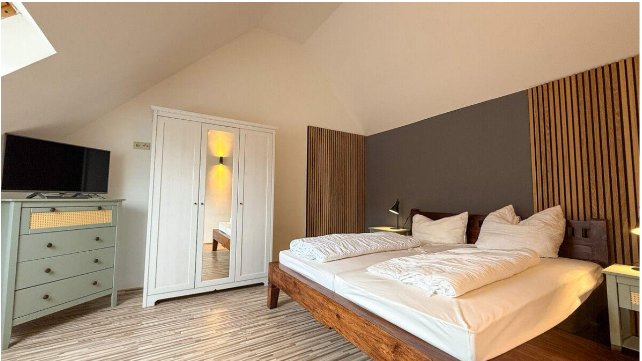
Schlafzimmer 2. OG