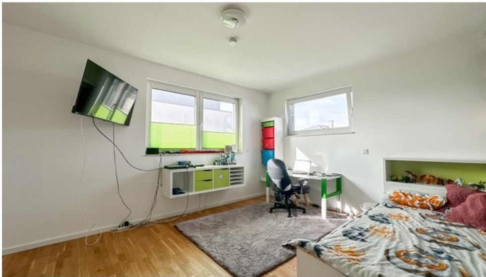
Kinderzimmer 2 (Obergeschoss)