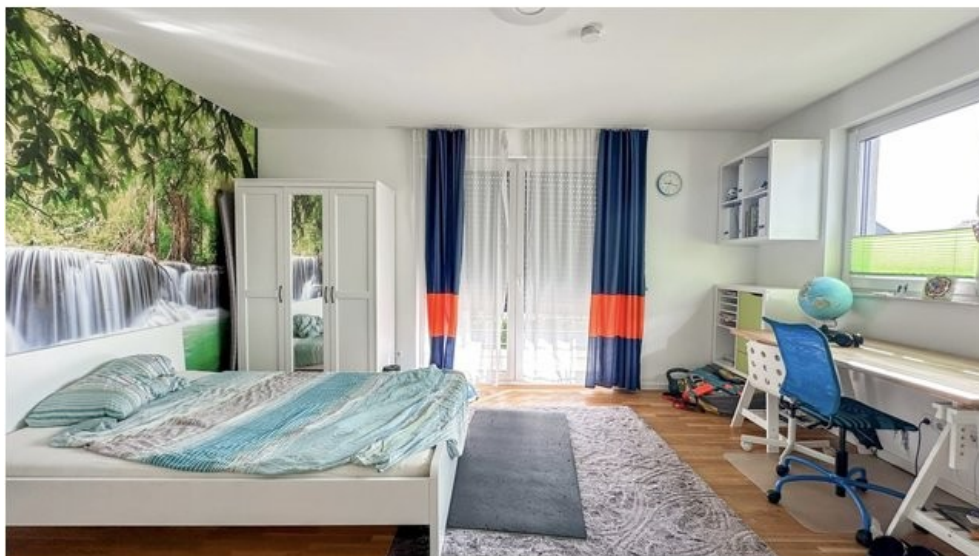
Kinderzimmer 1 (Obergeschoss)